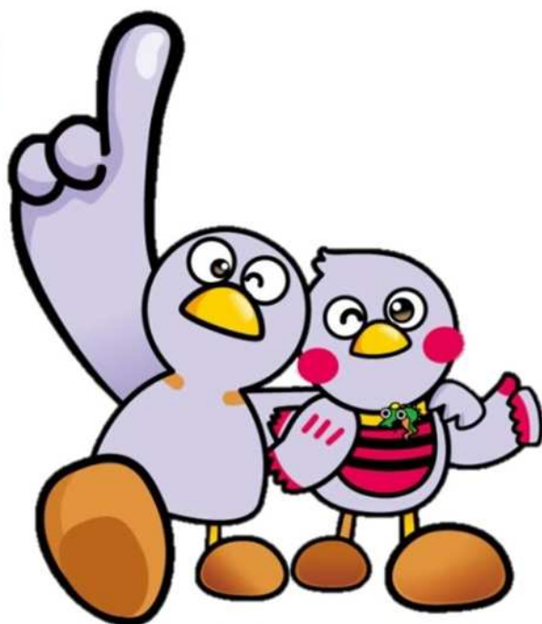
埼玉県マスコット 「コバトン」「さいたまっち」