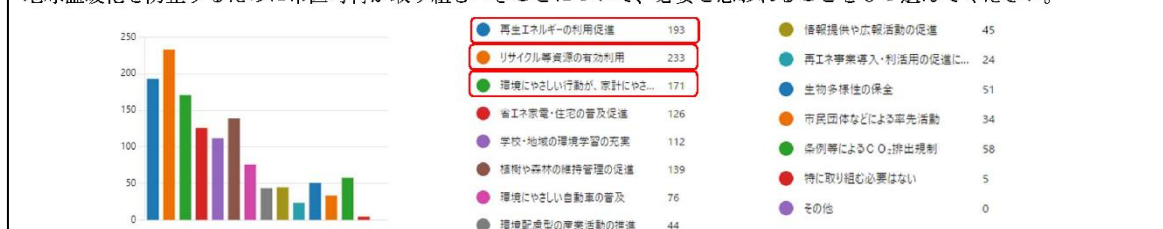
当日展示する「大学生の環境意識調査」より一部抜粋

地球温暖化を防止するために市区町村が取り組むべきことについて、必要と思われることを3つ選んでください。