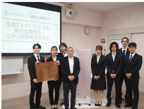
記者発表登壇者集合写真

この度、本学は「江戸小紋」の特質のマーケティング調査を行い、そこで明らかになった図案の制作理論をもとに、武蔵野大学で開発したオリジナルの生成アルゴリズムを活用した新しい図案をもとに、江戸小紋新作「スイーツ尽くし小紋」ができました。本研究によって制作した新作江戸小紋図案の発表並びに、新図案で染めた新商品の発表会を5月29日に行いましたことをごお知らせいたします。